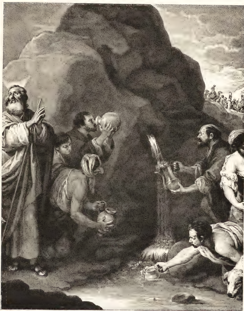
LE FRAPPEMENT DU ROCHER (PARTIE CENTRALE). (Hôpital de la Caridad, à Séville.)